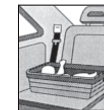
1. Babywannen und -schalen