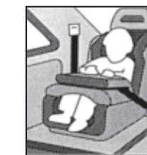
3. Vorwärtsgerichtete Kindersitze