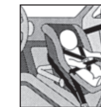
2. Reboard-Sitze und -Liegen